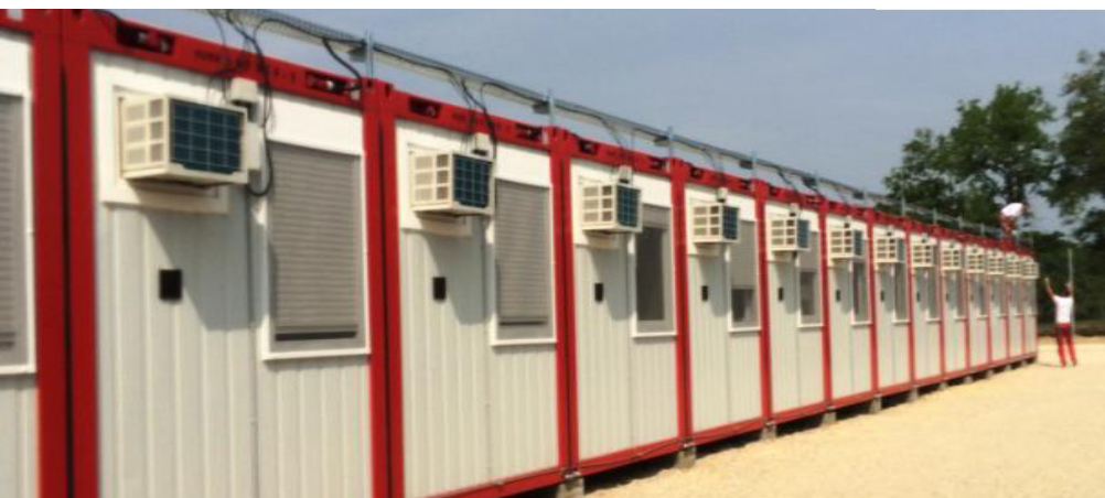
▼ Konténer szigetelés