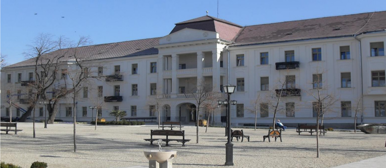
▲ Állami szívkörház, Balatonfüred.