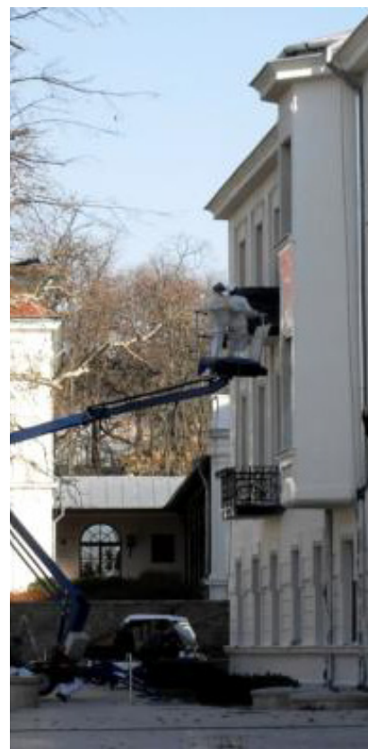
▲ Eifel Palace, Budapest