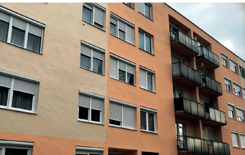
▲ Társasházak szigetelése