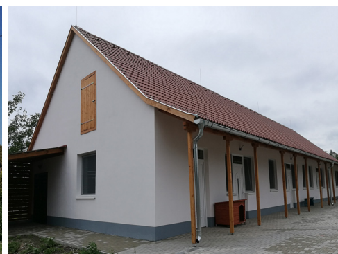
▲ Református gyülekezeti ház, Iregszemcse