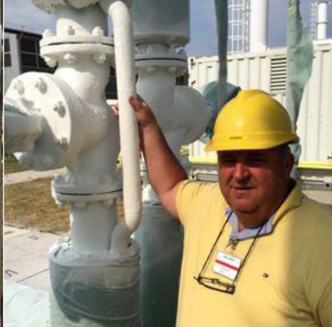
▲ Forró csövek szigetelése